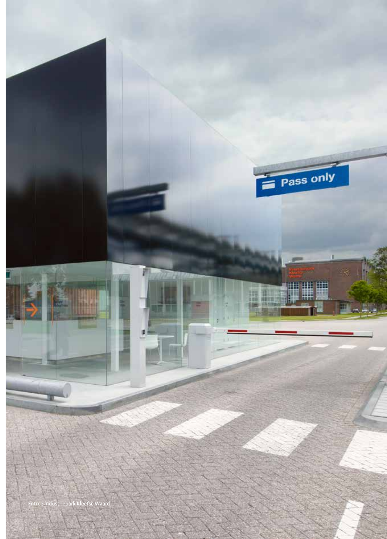
Entree Industriepark Kleefse Waard

Met Industriepark Kleefse Waard is een nieuwe standaard gezet voor bedrijventerreinen. Alleen al om die reden is Schipper Bosch een meer dan verdiende winnaar van de Gouden Piraamde 2015.