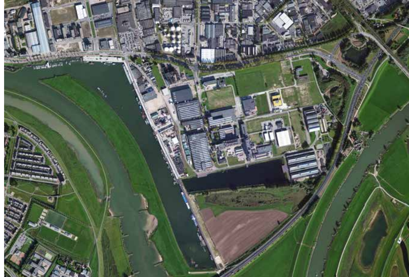
Industripark Kleefse Waard in Arnhem

Schipper Bosch heeft nooit de intentie gehad om Industripark Kleefse Waard na het te hebben ontwikkeld met winst van de hand te doen. Alle geld dat wordt verdiend, wordt weer in de ontwikkeling van het park geïnvesteerd. De bedrijfsruimten blijven dan ook in eigendom. Door ze te verhuren houdt Schipper Bosch de regie in handen en kan het de kwaliteit, de historische waarde en het duurzame en innovatieve karakter van het park en zijn gebruikers blijven bewaken.